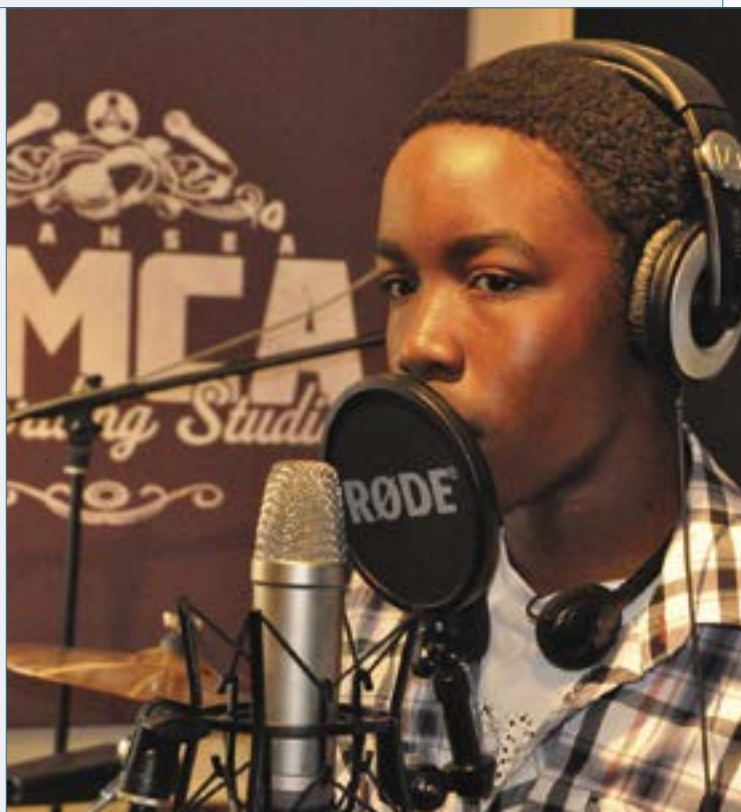
Prosiect Olion, Prifysgol Fetrapolitan Abertawe a'r YMCA, prosiect Cyrraedd y Nod

Daeth y rhaglen i ben yn 2013 ac mae Cyngor Celfyddydau Cymru wrthi'n ystyried rhaglenni strategaethol ehangach o bosibl ar gyfer y dyfodol, er mwyn cynnwys gweithgareddau diwylliannol eraill ac a fydd yn cael eu darparu ar y cyd â chyrrff eraill.