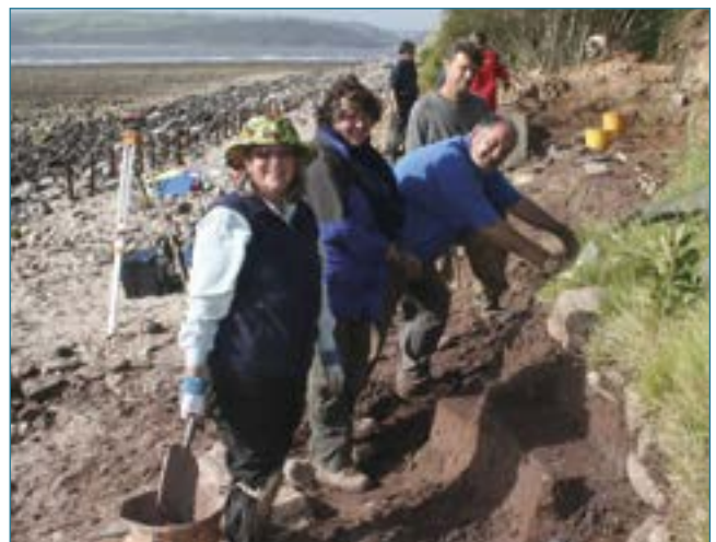
Gwirfoddolwyr o'r prosiect Arfordir a ariennir gan Cadw wrthi'n cloddio anheddiad canoloesol yn Sir Gaerfyrddin

Byddai symud ymlaen o gynllun gwirfoddoli cenedlaethol, felly, yn rhesymegol, yn fwy ymosodol a chydlynol ar draws Cymru i greu rhagor o sgôp ar gyfer prentisiaethau yn y sector diwylliannol. Mae angen dybryd am raglen gydlynol i godi nifer y prentisiaethau a gynigir i bobl ifanc ledled Cymru ac yn enwedig ar gyfer y rheini sy'n dod o gefndiroedd difreintiedig, gan adeiladu ar y gwaith rhagorol sydd ar y gweill gan Sgiliau Creadigol a Diwylliannol (Cymru). Byddai hyn yn galw am gydweithio agos rhwng Llywodraeth Cymru, y cyrff diwylliannol a chyrff sgiliau fel y corff ar gyfer y DU gyfan, yr Academi Sgiliau Genedlaethol ar gyfer Sgiliau Creadigol a Diwylliannol a'r cyrdd addysg bellach. Gallai agwedd o'r fath gael effaith fawr ar un o flaenoriaethau mwyaf pwysig Cymru, sef trechu'r mater o aelwydydd heb waith.