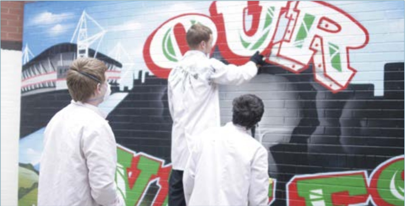
Prosiect Graffiti Treftadaeth Cadw – ymateb creadigol troseddwy'r ifanc i dreftadaeth

Mae'r bennod hon yn gysylltiedig ag effaith tlodi ei hun, strategaethau gwrth-dlodi presennol ar lawr gwlad fel y maent yn cysylltu â diwylliant, a sut y gallent gael mwy o ddylanwad ac effaith drwy bartneriaethau cyson, cynaliadwy, llawn dychymyg a thrwy rannu gwybodaeth, offer a hyfforddiant.